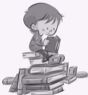
study the book

۵ شکل صحیح افعال داخل پرانتز را در جای خالی بنویسید.